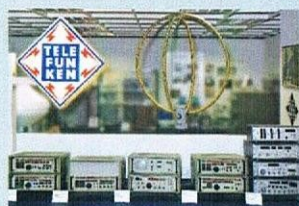
Moderne Funkempfänger ab 1969 prozessorgesteuert