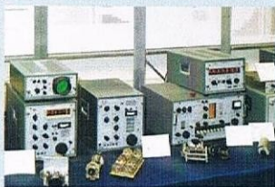
Ausschnitt aus der Ulmer Produktion von Empfängern von 1960 und 1970