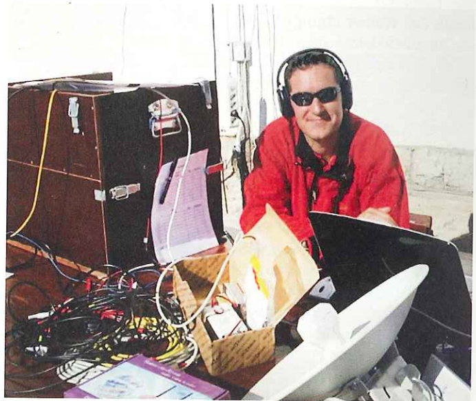
Neben der Drei-Zinnen-Hütte wurde eine Basisstation eingerichtet

N ur zur Erinnerung: beim Alpine-Run im Hochpustertal bewältigten fast 1.000 Läufer eine Strecke von 17,5 Kilometer und einen Höhenunterschied von immerhin 1.350 Metern. Kein Pappenstiel. Und der Parcours führte nicht etwa über geteerte Straßen, sondern über steile Serpentinwege und hochalpine Stege. Ziel des Laufes war die Drei-Zinnen-Hütte, gestartet wurde in Sexten. Der Schnellste brauchte dafür rund 1,5 Stunden.